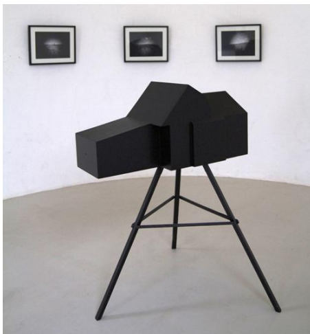
Black form #2 Maria © Alexis Judic Volume en bois / Tirages argentiques encadrés

Ces œuvres lient à la fois la sculpture, l'installation et l'architecture.