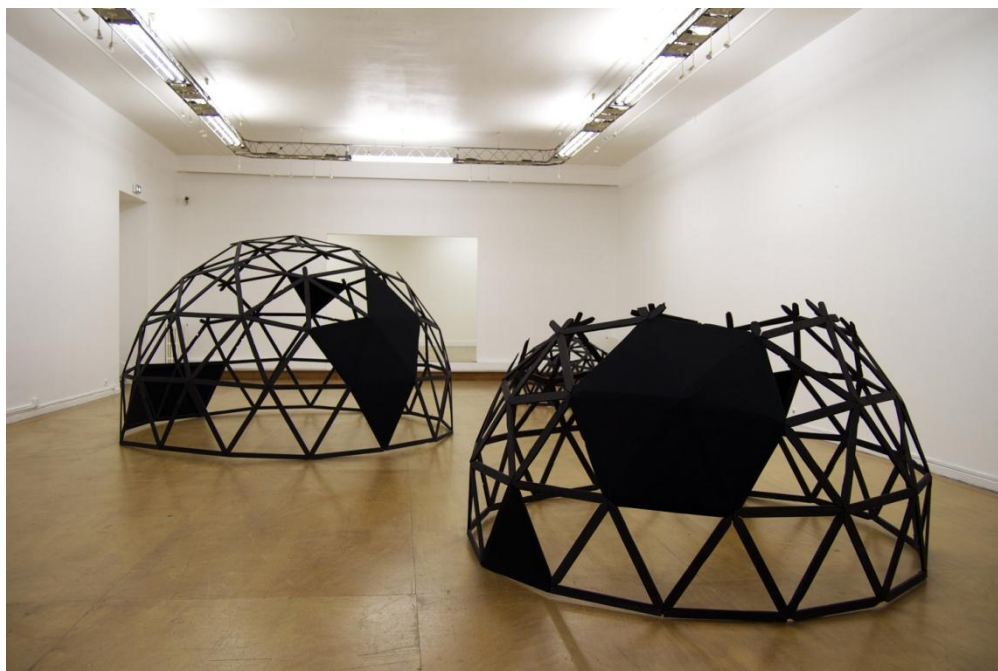
Drop city, 2011 © Alexis Judic Bois/Tissu/Peinture

Black form # 2 Maria est avant tout un objet, une sculpture, une installation issue d'une série dont la particularité, mis à part les formes polygonales et la couleur, est qu'elles sont une reproduction d'architecture dont l'échelle varie selon les projets. Formes provenant de l'univers du cinéma, de l'histoire de l'art et de l'architecture, Black form # 2 Maria est une reconstitution à échelle réduite de la Black Maria qui fut l'un des premiers studios de production cinématographique réalisé par Thomas Edison en 1893.