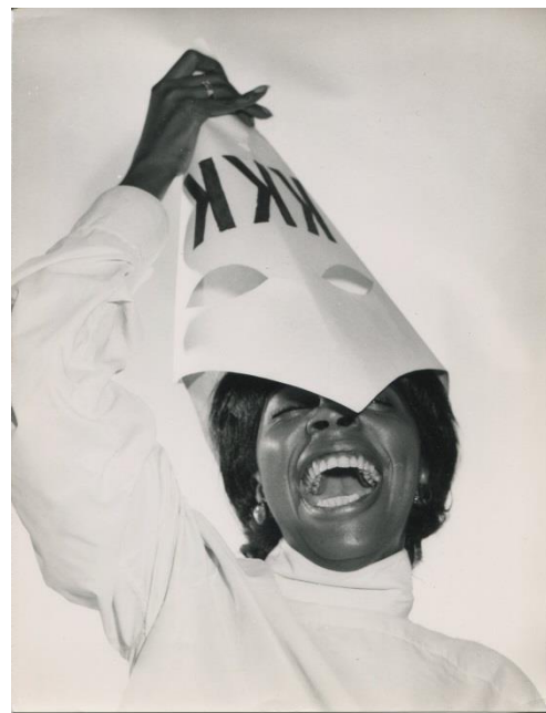
5 - HARA KIRI n° 63, mai 1966