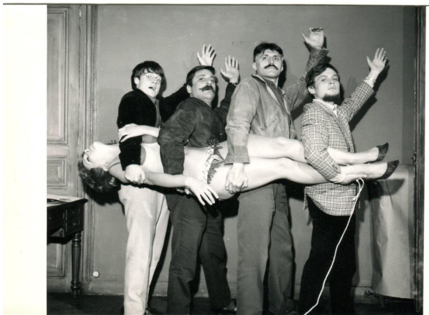
7 - HARA KIRI n° 31, septembre 1963, Hara-Kiri-Service Réponse à Tout , « Pr Choron, Je voudrais vivre entourée d'admirateurs » Modèles : Béatrice, Cabu, Fred, Cavanna, Reiser