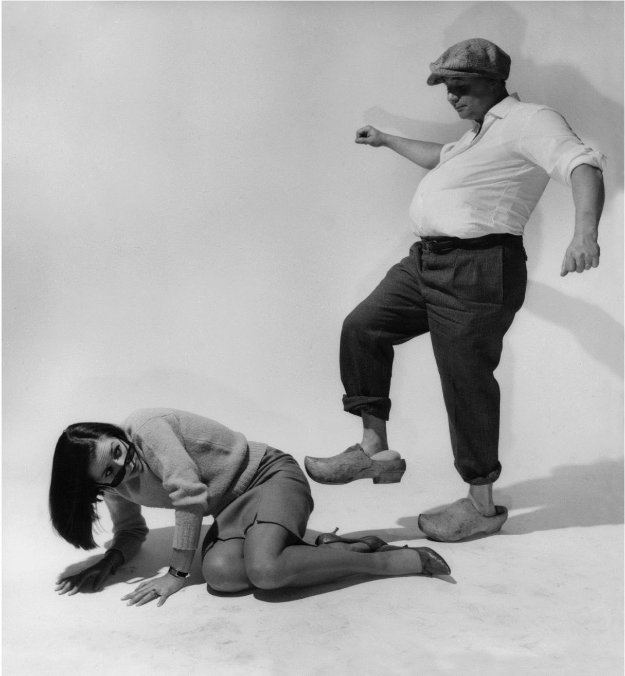
8 - HARA KIRI n° 46, décembre 1964