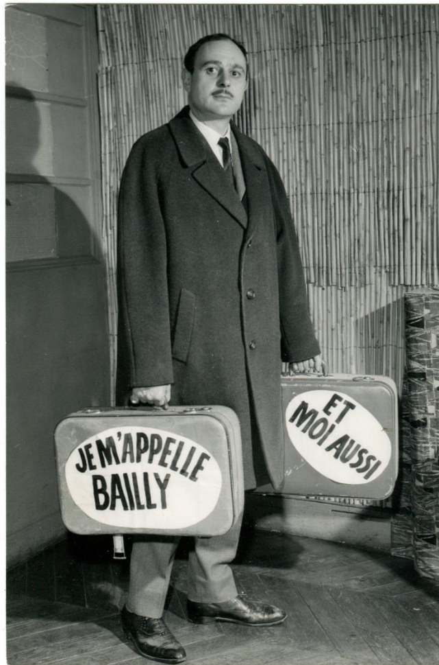
1- HARA KIRI 1962, Georget Bernier alias Le Professeur Choron. Première photo de la série des Professeur Choron