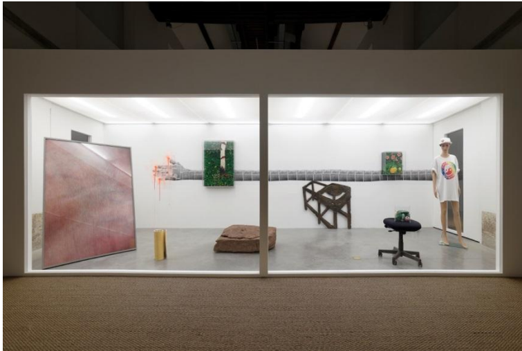
Vue de l'exposition Deep Screen Parc Saint Léger, Pougues-les-Eaux, 2015