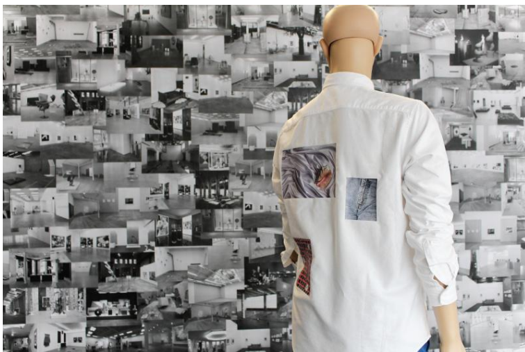
Vue de l'exposition Show Room Glassbox, Paris, 2015