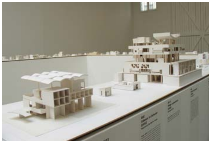
Vue de l'exposition

Tadao Ando est né à Ôsaka le 13 septembre 1941.