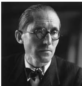
Le Corbusier.

Dans les dernières années de sa vie, il s'engagea dans un travail de peintre et de céramiste.