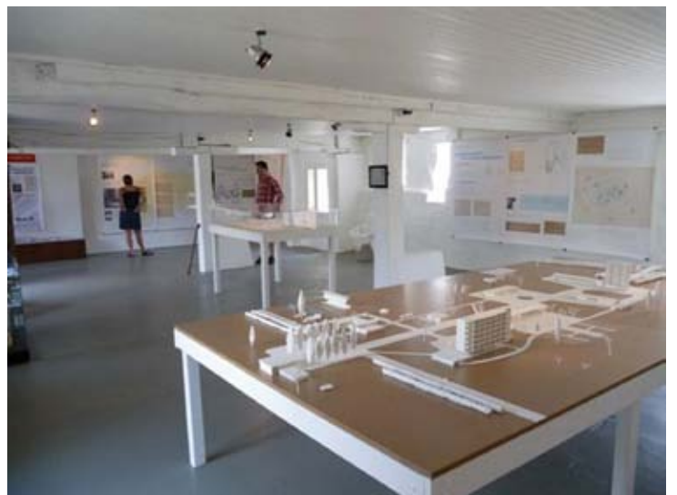
Vue de l'exposition, Juin 2010. © Piacé le radieux, Bézard - Le Corbusier.

L'association remercie la Fondation Le Corbusier pour son soutien.