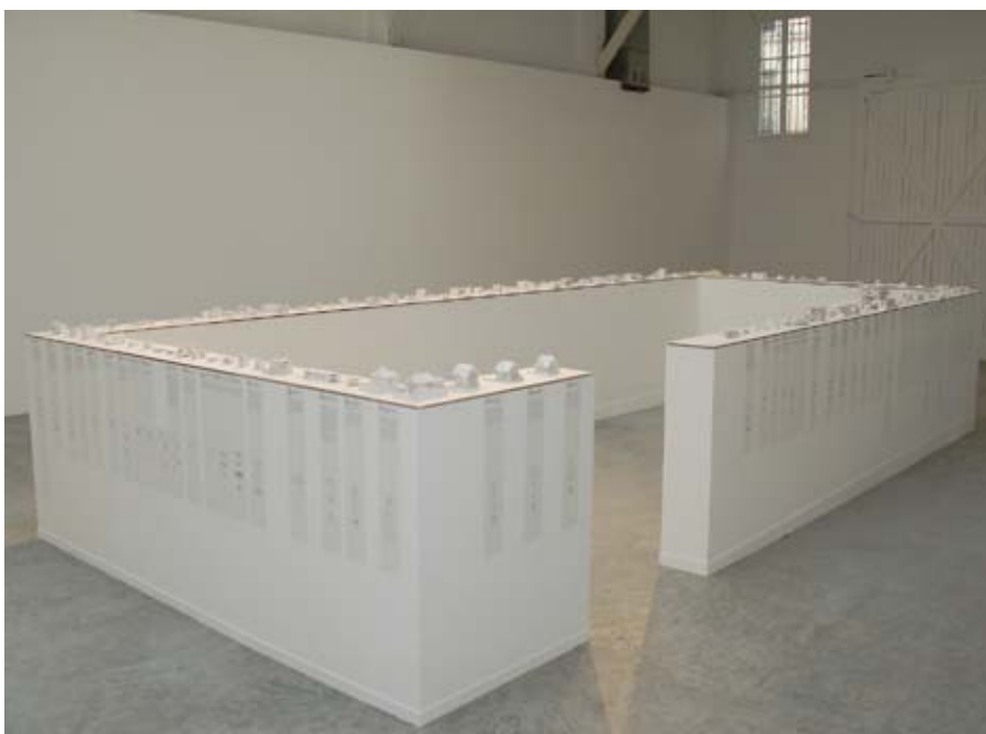
Vue de l'exposition, Photo. Galerie Patrick Seguin © FLC/ADAGP