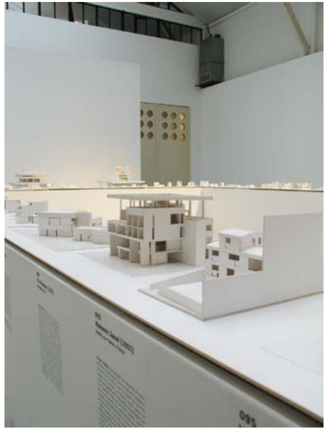
Vue de l'exposition, Photo. Galerie Patrick Seguin © FLC/ADAGP

«Tout a commencé par une maquette de la villa Savoye réalisée, dans le cadre de ses recherches, par l'un de mes étudiants, grand admirateur de Le Corbusier. Lorsqu'il m'a confié son souhait de poursuivre ses travaux sur d'autres projets d'habitation de Le Corbusier, j'ai saisi l'occasion pour proposer une exposition à la Gallery MA. Le but était de rendre visible la démarche architecturale de Le Corbusier et de révéler une trace de sa pensée.»