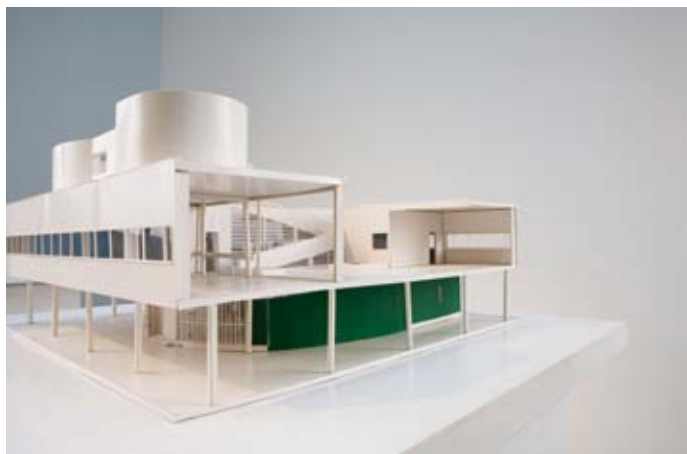
Villa Savoye, 1928

Cet ensemble, exposé pour la première fois à la Gallery MA (Tokyo) en 2001, fait l'objet d'une donation de Tadao Ando à la Fondation Le Corbusier.