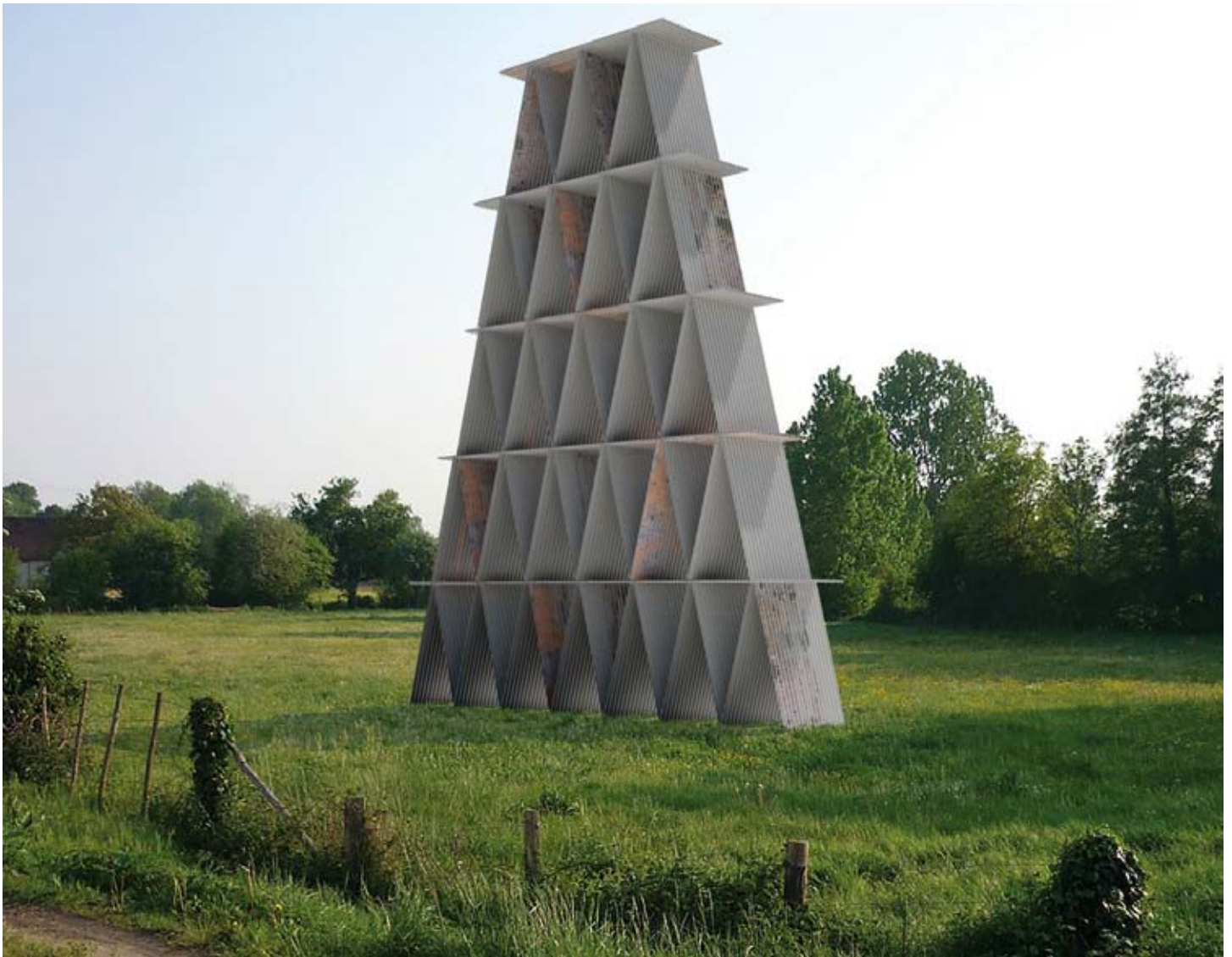
Château de tôle, Stéphane Vigny, 2011. Dessin 3D, Guillaume Coquet. Production Piacé le radieux.