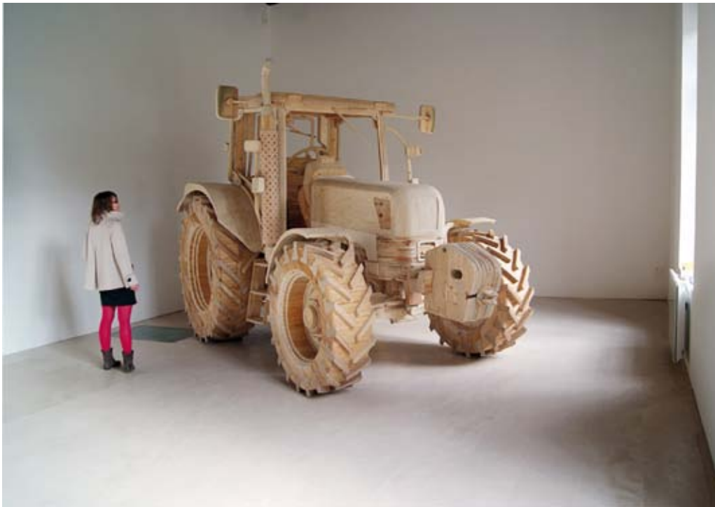
New Holland, Pascal Rivet, 2009. © Domaine de Chamarande

Maquette et sculpture, contre-plaqué et voliges, 465 x 220 x 280 cm