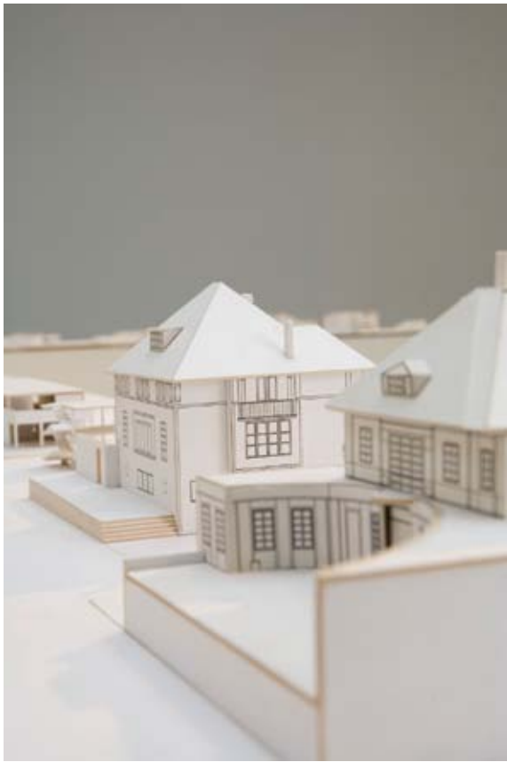
Villa Favre-Jacot et Villa Jeanneret-Perret, 1912