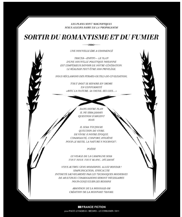
Projet , plaque émaillée de four à pain, France Fiction, 2011. Production Piacé le radieux