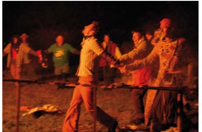
Burning Vogue, Andrea Crews, 2010.

En 2010, pour La Quinzaine radiieuse #2, Andrea Crews lançait l'idée d'un feu de joie « Burning Vogue » célébrant le solstice d'été et le début des moissons. La performance est reconduite cette année, certainement sous d'autres formes, mais avec le même esprit fédérateur.