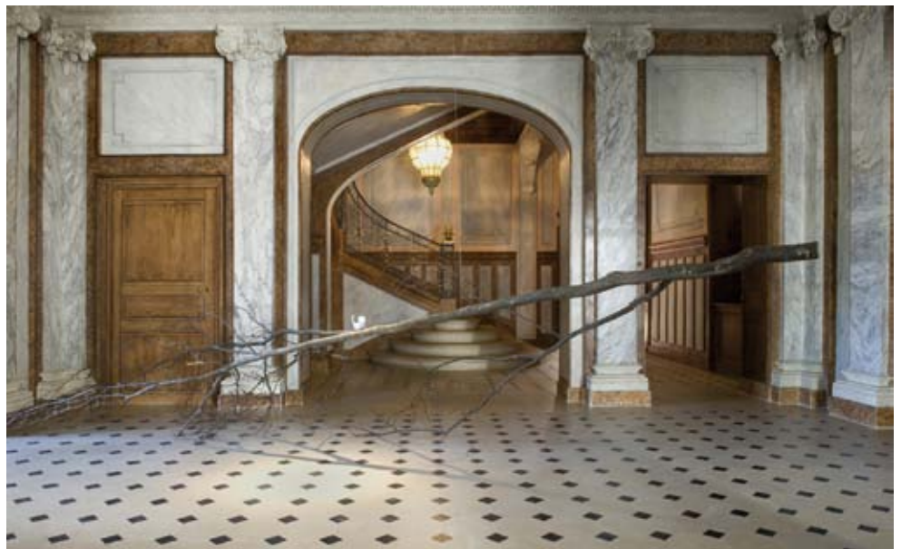
Suspens , Hugues Reip, 2009.