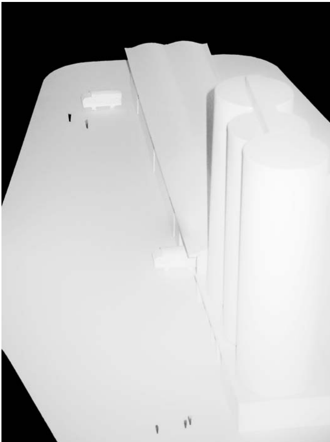
Photographie , maquette, silos du village coopératif de Piacé, France Fiction, 2010.