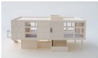
Le logis de la Ferme radieuse, Le Corbusier, 1934