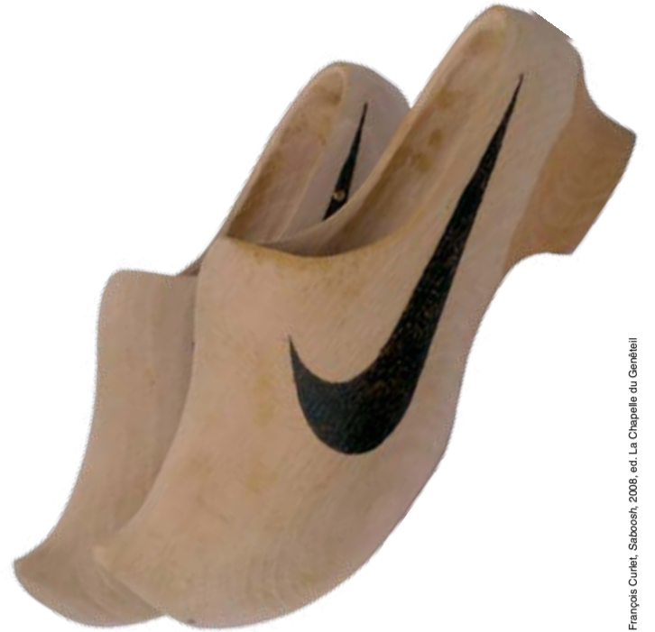
Francis Cuniet, Saboteur, 2008, ed. La Chapelle du Gardien

BÉZARD - LE CORBUSIER LA FERME RADIEUSE ET LE VILLAGE COOPÉRATIF