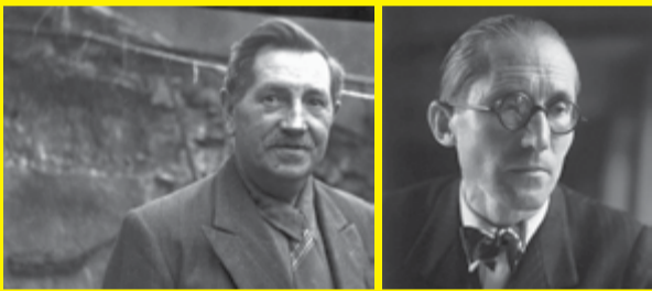
Norbert Bézard et Le Corbusier. © FLC - ADAGP

Le reste de l'année, des œuvres permanentes d'artistes contemporains sont visibles dans le village. Elles composent un parcours artistique invitant à renouveler notre regard sur les campagnes.